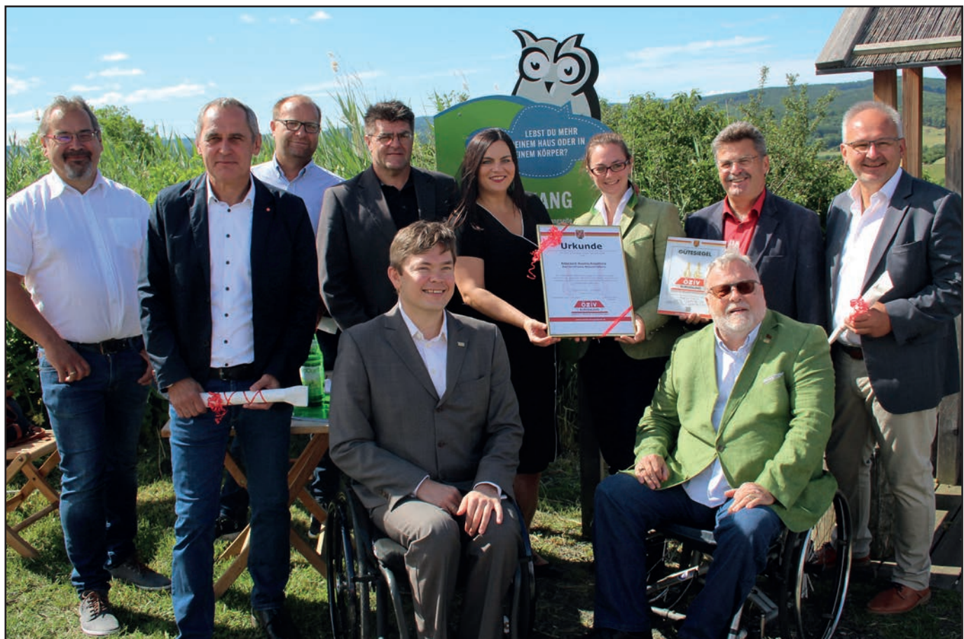
Überreichung des Zertifikates „Barrierefreies Naturerlebnis“ Siehe Bericht Seite 6.